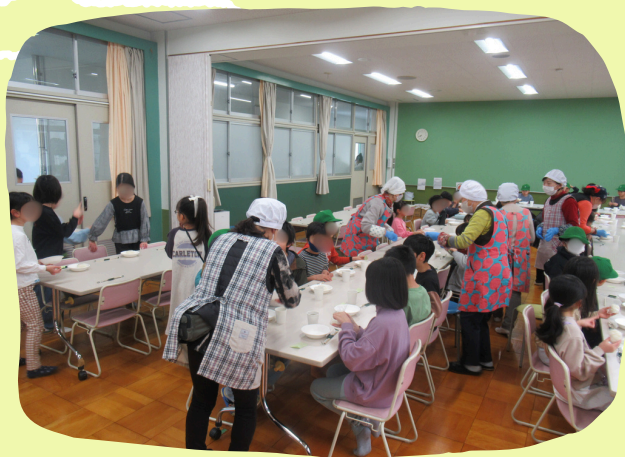
▲歳末たすけあい募金を活用したこども食堂（西山本地区）