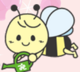
八尾市社協の公式キャラクター 「ヤッピー」