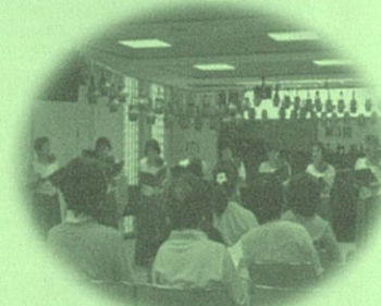
グループまほろば