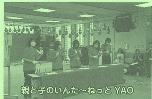
親と子のいんた～ねっと YAO

祭りだ、祭りだ(^_^)ワッショイ、ワッショイ (^_^)午後の部の様子を少し覗いてみました。