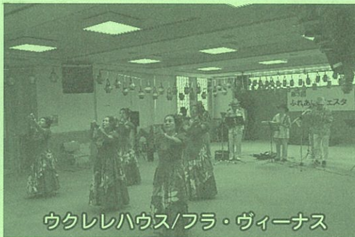
ウクレレハウス/フラ・ヴィーナス

ふれあいフェスタは、2018年に第1回、19年に第2回が開催されました。2020年からの3年間 はコロナ禍のため開催が見送られて来ましたが、 今年5月の5類への移行を受けて、4年ぶりに開 催されました。