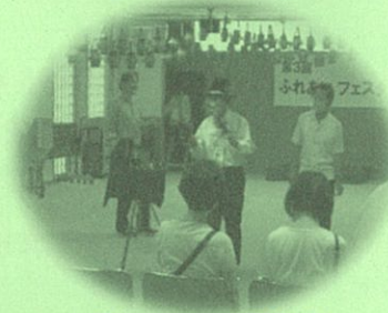
八尾マジック同好会